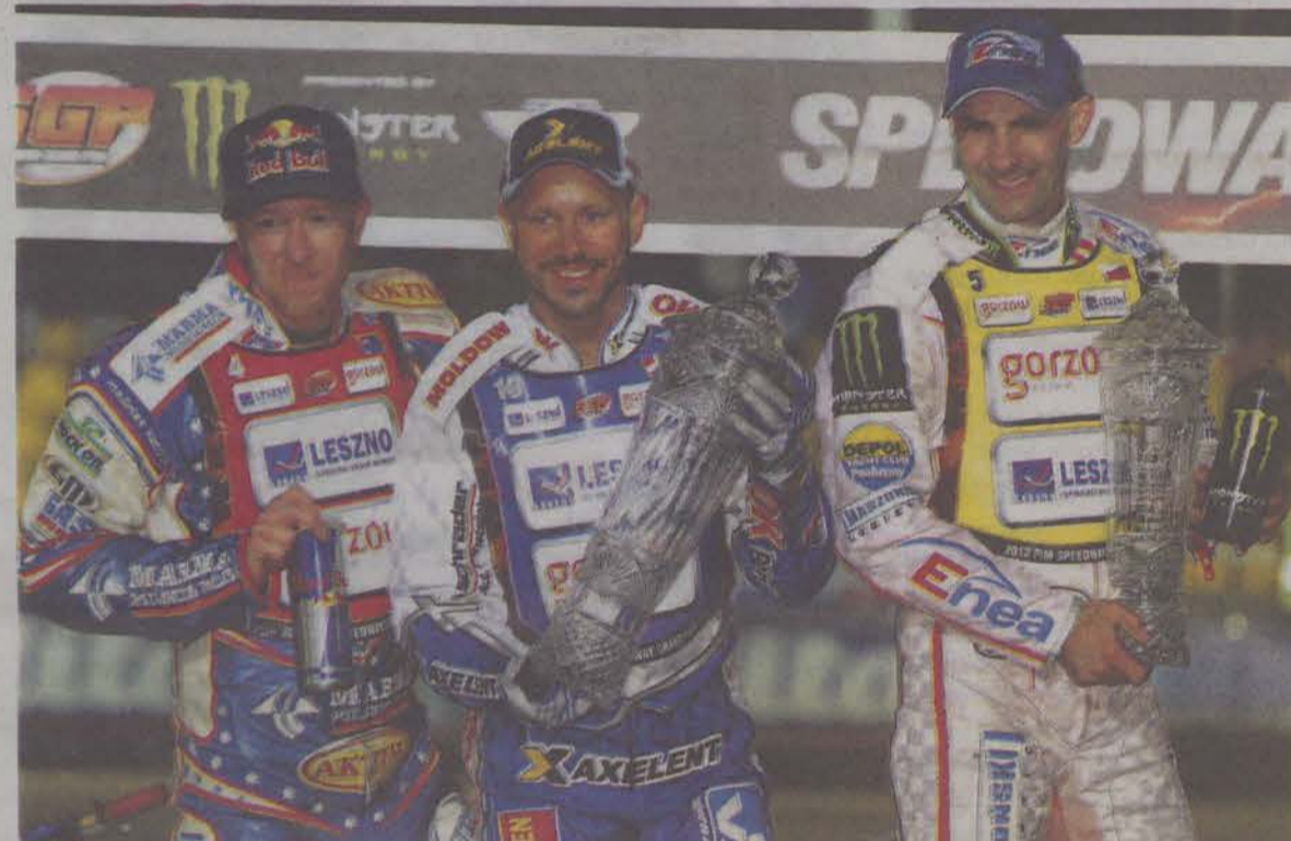
Podium Grand Prix Czech. Od lewej: Jason Crump, Nicki Pedersen i Tomasz Gollob.

Jason Crump (Australia): - Zdobyłem najwięcej punktów, ale nie udało się wygrać i dlatego jest mały niedosyt. W finale o wszystkim zadecydował start. Potem Nicki nie popełnił żadnego błędu i niewiele mogłem zrobić. Od dawna czekałem na taki wynik w Grand Prix. Mam nadzieję, że to początek mojego powrotu na sam szczyt. Kiedyś wygrywałem na zawołanie. Chciałbym