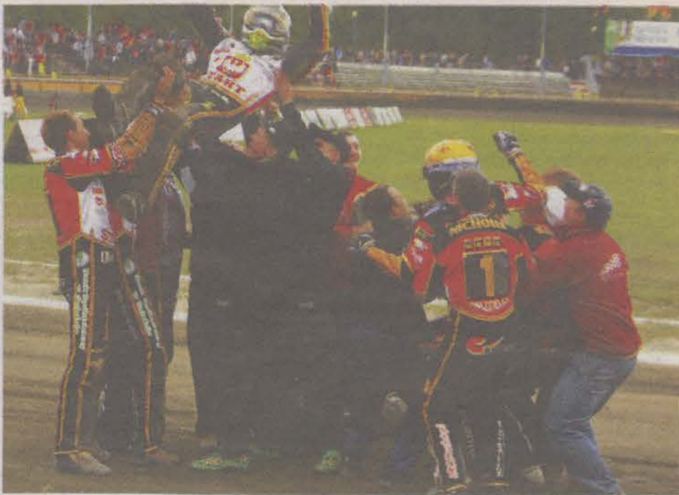
Radość drużyny Startu po zwycięskim meczu.