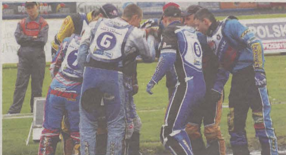
Tak mobilizowali się żuźlowcy Kolejarza Opole przed meczem w Krośnie.