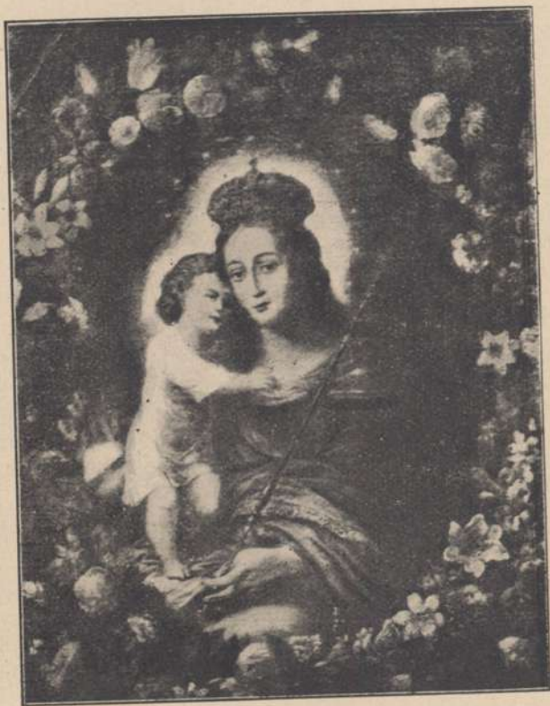
Matka Boska Gimnazjalna — szkoła flamandzka z r. 1683.

Drugie piętro przeznaczono na siedzibę nauk przyrodniczych i dlatego tam znajdują się: pracownia biologiczna z dwoma gabinetami, sala wykładowa fizykalna z przylegającą do niej pracownią fizykalną i 2 gabinetami na przybory do fizyki. Pracownia chemiczna, urządzona według najnowszych wymogów, znalazła pomieszczenie w suterynach, gdzie też urządzono salkę robót ręcznych.