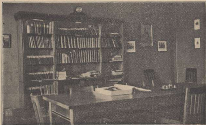
Biblioteka podręczna świetlicy.