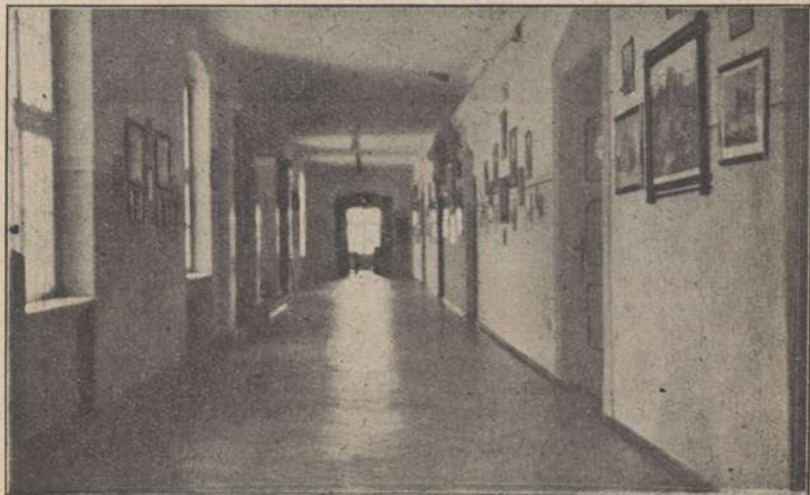
Korytarz I piętra

nazwiska ofiarodawców. Ponieważ pozostał jeszcze szereg okien niewykupionych w innych stronach gmachu — namalowano drugi afisz, o rozmiarach tych samych, na którym autor umieścił portrety najczęściej znanych w mieście obywateli. I ten rysunek okazał się w skutkach, jako reklama zbiórki okien — bardzo dobrym. W dniu 16. II. 1923 Kom. Bud. G. zakupił w Poznaniu ogrzewanie centralne. Celem zasilenia kasy, która stale cierpiała na brak pieniędzy, urządzono w dni 7. IV. 1923 jeden koncert, a 22. IV.