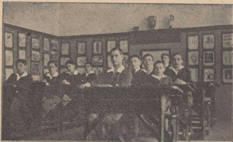
W klasie IV

Rok 1930. Po wieloletniej pracy, po trudach i wysiłkach doprowadzono wreszcie do tego, że prawie wszystkie warsztaty pracy były urządzone, aczkolwiek może jeszcze nie zupełnie, to jednak w takiej mierze, że dawały możliwość do nowoczesnego traktowania nauki. Były zatem czynne: pracownia biologiczna, fizyczna, chemiczna, szklarska i stolarska, dalej sala rysunkowa i salka gimnastyczna. Funkcjonowały: Świetlica uczniowska i biblioteki (nauczycielska, uczniowska polska, niemiecka i francuska). Pomoce naukowe znajdowały się w dostatecznej ilości, aczkolwiek jeszcze nie zadowalającej. Można się było zatem zwrócić w kierunku pogłębiania metod pedagogicznych. I tej to pracy, żmudnej, ale wdzięcznej, a w nowoczesnie pojętej szkole nieodzownej — poświęcone było II półrocze roku szk. 1929/30.