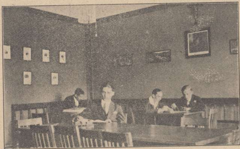
W Świetlicy uczniowskiej

Temu więc celowi właśnie służą także owe wyżej wymienione „poranki”, jak również rozmieszczenie po korytarzach zbiorów i pomocy naukowych, sposób rozwieszenia obrazów*) (z szczególnym uwzględnieniem walcrów estetycznych), z gustem urządzona świetlica, służąca do rozrywki i swobodnej popołudniowej nauki (obfita biblioteka z licznymi dziełami encyklopedycznymi i pięknie ilustrowanymi albumami) i wiele innych drobnych urządzeń, które razem więc mają stworzyć to, co nazwalibyśmy „atmosferą kulturalno-naukową”. Nie można tu także pominąć takich imprez, jak odbyty tydzień czystości, albo urządzenie niektórych uroczystości w formie wspólnej herbatki. Dotykamy tu zarazem sprawy niezwykle ważnej, związanej ściśle z poprzednim celem, a mianowicie sprawy przyswojenia wychowankowi gimnazjum tych form obyczajowych i towarzyskich, które znamionują ludzi kulturalnych. Jest to dziedzina — należy wyznać — u nas stosunkowo zaniedbana, lecz wagę jej całe grono silnie odczuwa i praca nad nią będzie szczególnie zadaniem naszym w najbliższej przyszłości.