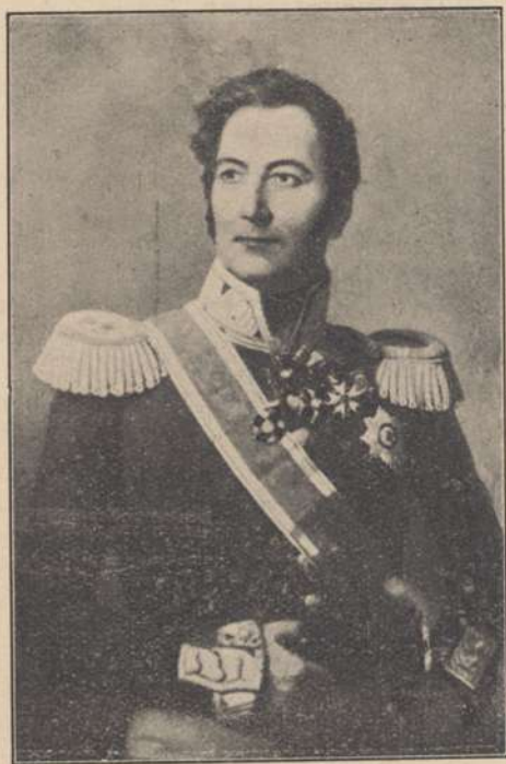
General Franciszek Morawski