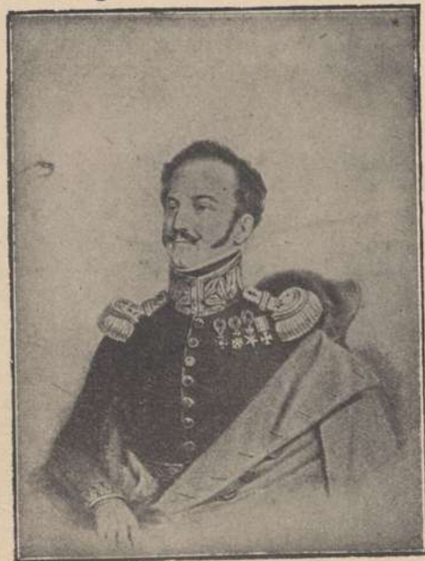
Gen. Jan Nepomucen Umiński

Jan Nepomucen Umiński urodził się 9. lutego 1778 1) w Czeluścinie, jako syn Hilarego, starosty bielskiego, i Franciszki