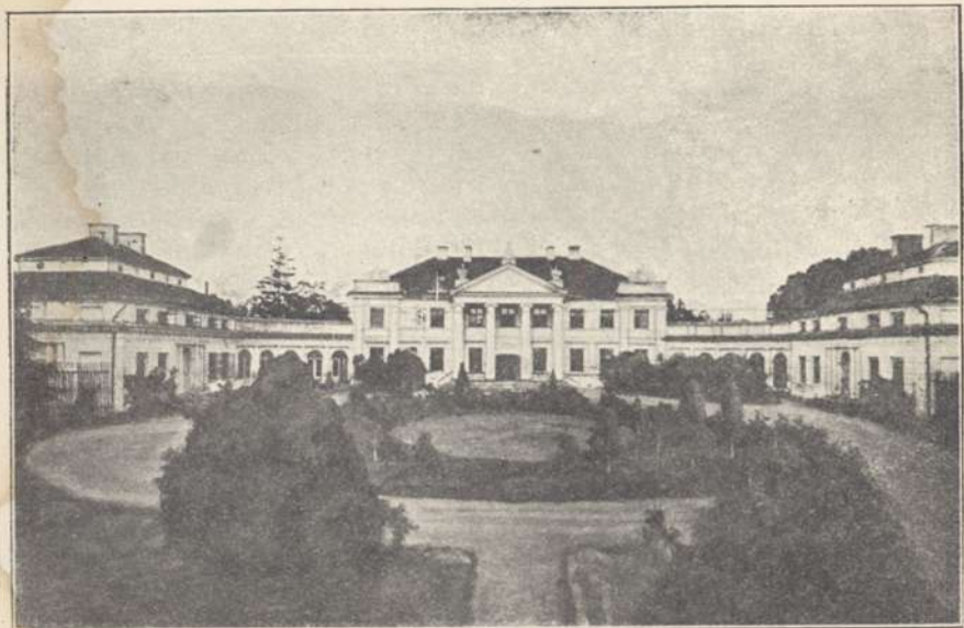
Pałac: pokój Mickiewicza +.