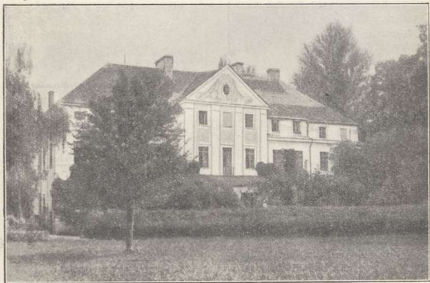
Pałac w Kopszewie, w stanie z 1830.