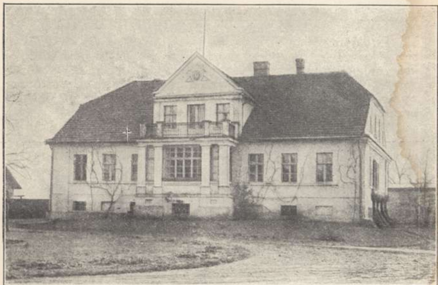
Oficyna: pokój Mickiewicza +.