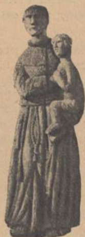
Św. Antoni w Smolicach

w kształt jaki dyktował jej świat chłopskiej wyobraźni, ustąpić musiał fabrycznej tuzinkowej lichocie.