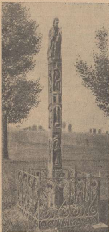
Św. Maciej na Goruszkach