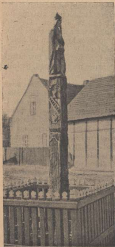
Św. Florian w Zakrzewie

górnego piętra przystroił snycerz symbolami: z lewej kielichem, drabiną i sercem, z prawej młotem, kleszczami i 30 srebrnikami w 3 pionowe rzędy ułożonymi i otoczonymi ramką wypukłą jak to widoczne na rycinie. Ściana tylna bez podziału na kondygnacje pozbawiona jest zupełnie ozdób.