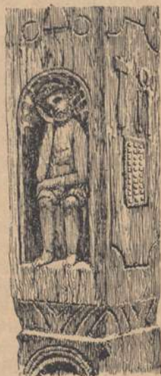
Fragment z figury w Zakrzewie

wyżej prosty wcięta linią tylko zaznaczony gzyms tworzy podstawę dla wznoszącej się na szczycie postaci św. Floriana w powłóczystym płaszczu i hełmie, z chorągwią w lewej, a kubłem w prawej ręce. Boczne płaszczyzny słupa pozbawione są na dwóch dolnych kondygnacjach jakichkolwiek poza obramowaniem ozdób. Jedynie płaszczyzny