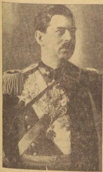
W związku z wizytą w Polsce min. Antoniescu, reprodukuje portret króla rumuńskiego Karola II-go.