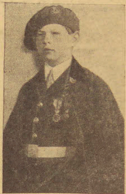
Rumuński następca tronu Wielki Wojewoda ks. Michał.

W dniu 22 bm. ukazał się w Warszawie nowy tygodnik polityczno-społeczny p. n. „Podbipięta“. W artykule programowym p. t. „O normalną Polskę“ redakcja „Podbipięty“ przeprowadza myśl, iż wszystko, co się dzieje obecnie w Polsce jest sui generis stanem „wojny domowej“, który hamuje normalny rozwój społeczeństwa i państwa i nie pozwala na rozstrzygnięcie żadnego z zasadniczych problemów natury ogólnej. Dla uzdrowienia opinii i oczyszczenia atmosfery niezbędne jest, zdaniem redakcji, „uzdrowienie przede wszystkim warstwy oświeconej, bo ona jest właściwą autorką obecnego rozłamu“. Potrzebna jest jedność narodowa nadewszystko.