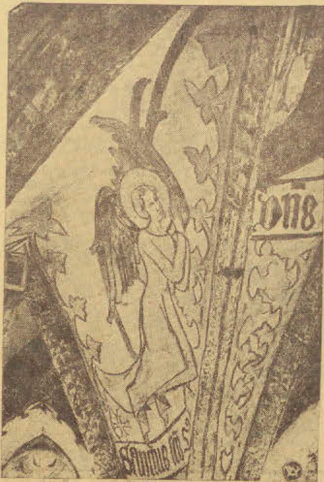
Jeden z odkrytych pod tynkiem artystycznych fresków z XIV wieku na sklepieniu presbiterjum kościoła św. Jakóba w oraniu.

Artykuł kończy się przytoczeniem słów m. Becka, że mało jest sojuszków tak prostych i tak jasnych, jak sojusz polsko-rumuński (PAT).